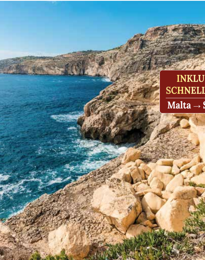
Dingli Cliffs: einer der schönsten Panoramapunkte Maltas

In Mosta besichtigen wir die monumentale Rotunde. Ihre Kuppel gehört zu den größten Europas. Bei der Stadtführung entdecken wir die kunstvolle Architektur und erfahren mehr über die Geschichte dieses eindrucksvollen Bauwerks. Weiter geht es nach Mdina, die frühere Hauptstadt der Insel. Wegen ihrer autofreien Straßen wird sie auch „die stille Stadt“ genannt, deren Adelshäuser und grandiose Paläste das zeitlose Ortsbild prägen.