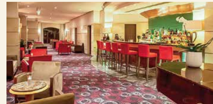
Die Hotelbar ist der ideale Treffpunkt am Abend