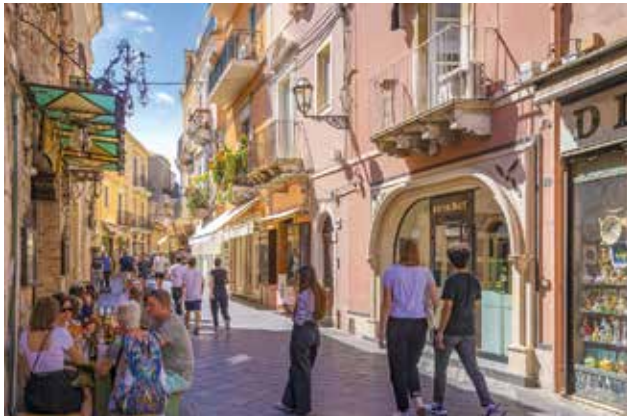
Freizeit für einen Altstadtbummel