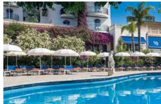
Gönnen Sie sich eine Auszeit am Pool