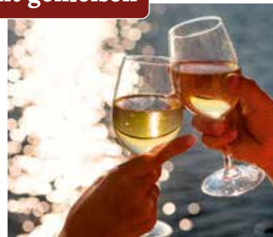
Den Augenblick genießen

Am Strand von Giardini-Naxos heißt es ein letztes Mal: die Seele baumeln lassen. Wer möchte, bummelt entlang der Promenade mit Cafés und kleinen Geschäften, die typische Souvenirs wie handbemalte Keramik oder Schmuck aus Lavastein anbieten. Dieser Tag gehört ganz der Erholung – ein Cappuccino mit Meerblick, barfuß durch den warmen Sand spazieren – ein letztes Stück Dolce Vita, bevor wir am nächsten Tag Abschied nehmen.