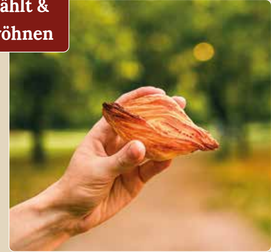
Pastizzi – maltesisches Streetfood