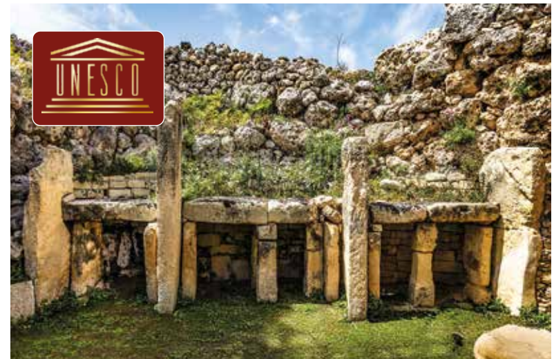
Ggantija, eine der ältesten frei stehenden Kultstätten der Welt

Mit dem Schiff gleiten wir hinaus auf das glitzernde Blau des Mittelmeers und genießen die weite Aussicht, bis die Silhouette von Gozo am Horizont erscheint. Auf der Insel beginnt unsere Rundfahrt mit dem Besuch des Ggantija-Tempels, eines der ältesten frei stehenden Bauwerke der Menschheit. Von der Calypso Cave eröffnet sich ein herrlicher Blick auf die rotgoldene Ramla Bay, bevor wir beim Spaziergang durch Victoria die charmante Inselhauptstadt kennenlernen. Ein Fotostopp an der berühmten Wallfahrtskirche Ta' Pinu, die für ihre Wunderberichte und Heilungslegenden verehrt wird, sowie Freizeit im malerischen Küstenort Xlendi runden diesen abwechslungsreichen Ausflug ab.