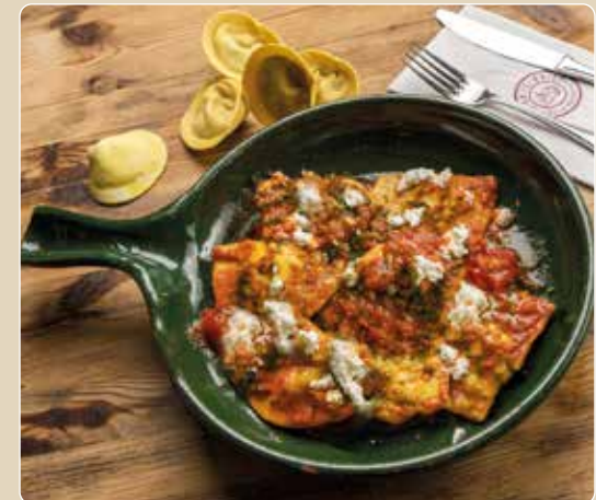
Ravioli Malti – traditionelles Inselgericht

Mit der modernen Katamaranfähre fahren wir in weniger als zwei Stunden nach Sizilien. Wir haben für Sie Plätze in der exklusiven Club-Lounge reserviert. Damit verbunden ist ein bevorzugter Check-in/-out und ein bequemer Kofferservice. In der Lounge werden wir mit einem Sekt begrüßt und können es uns in den Liegesesseln bequem machen. In Sizilien angekommen, fahren wir mit unserem Reiseleiter zum Hotel.