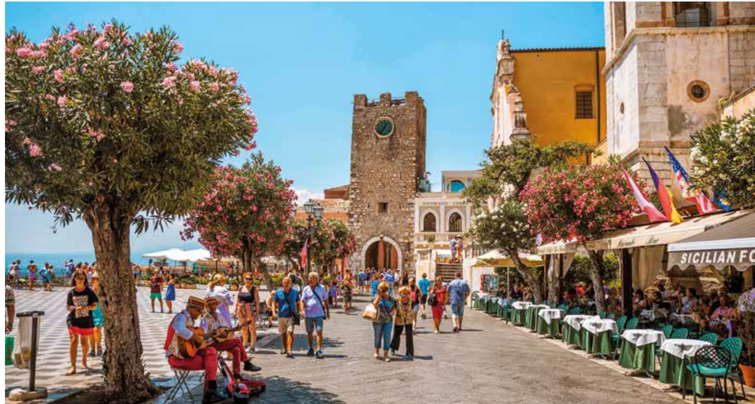
Belebter Platz im Herzen von Taormina mit historischen Fassaden und gemütlichen Straßencafés

Am Aussichtspunkt Bellavista genießen wir das weite Panorama vom Meer bis zum majestätischen Ätna. Anschließend erkunden wir Taormina bei einer Stadtführung. Bereits in der Antike gegründet, begeistert es bis heute mit eleganten Palazzi, malerischen Gassen und mediterranem Flair. Berühmt ist die Stadt auch für ihr antikes Theater, das zu den eindrucksvollsten Bauwerken Siziliens zählt. Zum Ausklang lädt die Altstadt mit ihren Cafés zum Verweilen ein.