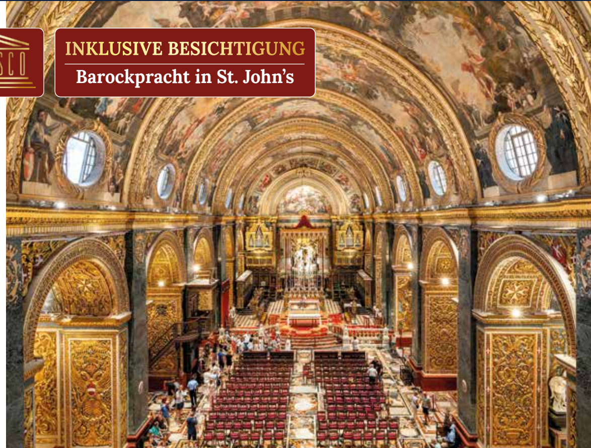
Die St. John's Co-Kathedrale in Valletta – schlicht von außen, im Inneren ein barockes Prunkstück mit reich verzierten Bögen und prachtvollem Altarraum

INKLUSIVE BESICHTIGUNG Barockpracht in St. John's