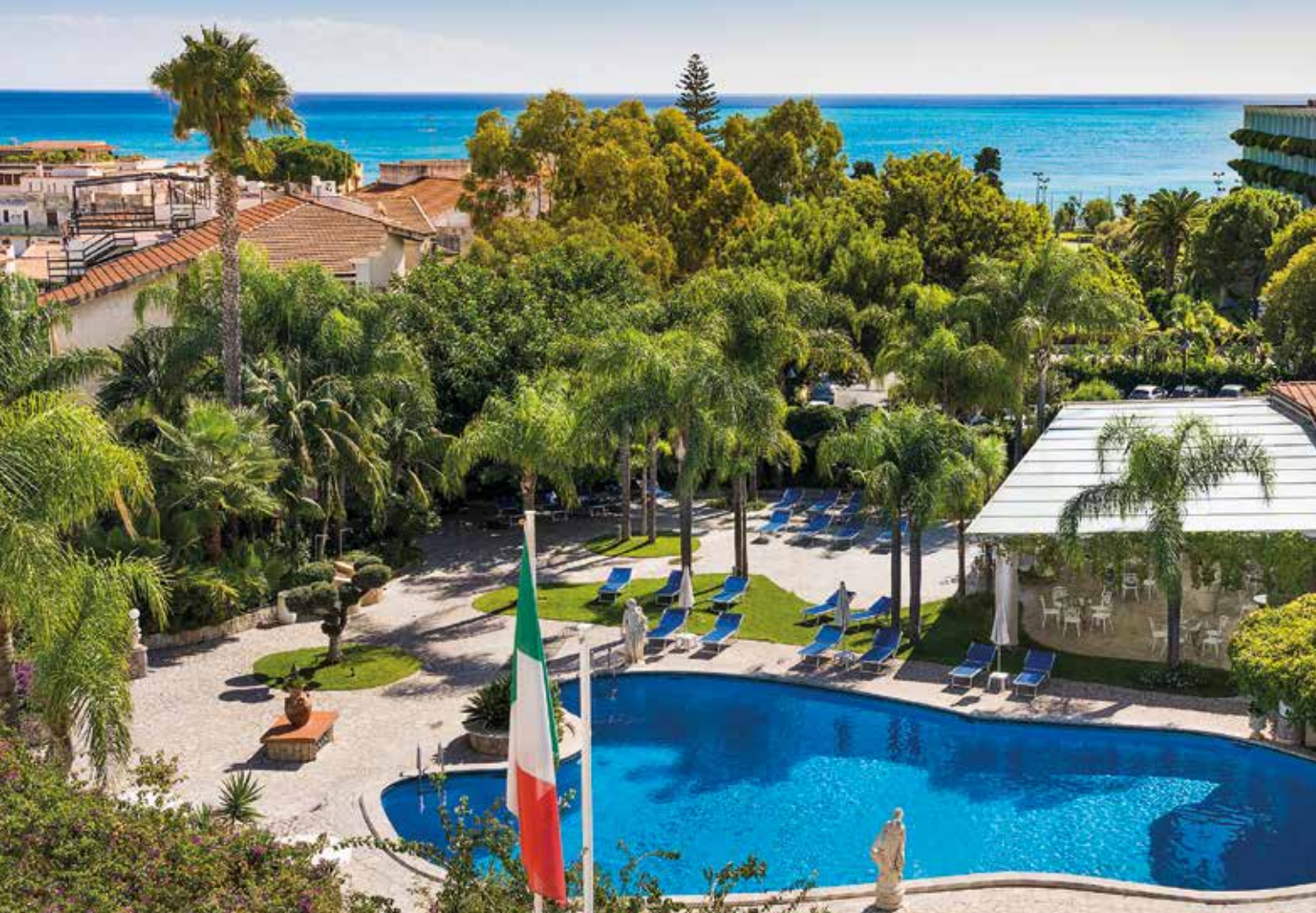
Urlaubsfeeling pur: Pool, Palmen und das Meer ganz nah