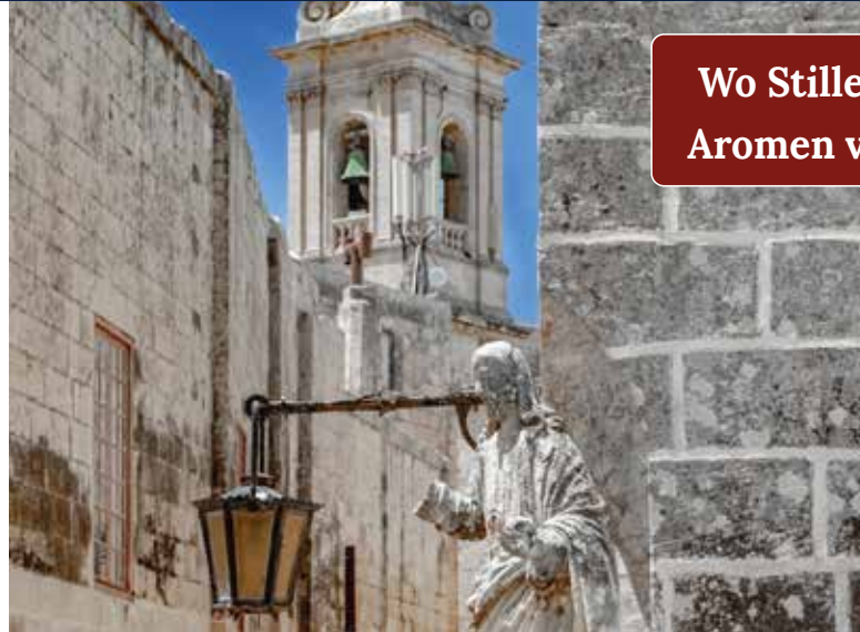
Mdina – barocke Zeitzeugen in stiller Kulisse